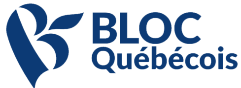
Xavier Barsalou Duval

Député de Pierre-Boucher – Les Patriotes – Verchères